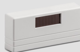
Sensore di umidità e di temperatura esterno SFT-EO